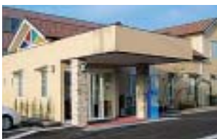
岡部こども医院前景