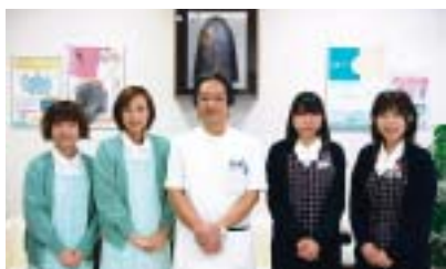
森先生とスタッフの皆さん

雪化粧した立山が美しく映え、寒さも一段と厳しく感じるようになった12月13日（火）富山市天正寺で今年5月開業された“もりクリニック”を訪問させていただきました。