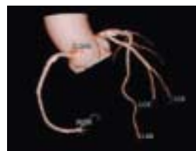
図1. 160スライスCTシステムで撮影した冠動脈3D画像(正常例)

これらの最新機器を有効活用し、地域の先生方や患者さんからよりいっそう信頼していただける画像診断・IVRを行っていただけるようスタッフ一同努力してまいります。今後ともよろしくご依頼申し上げます。