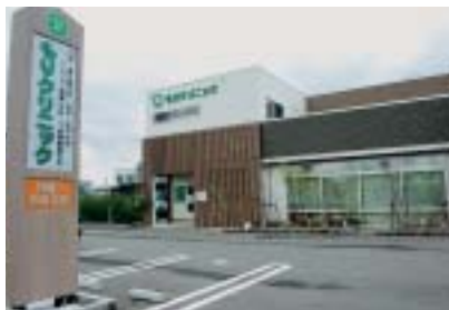
もりクリニック前景