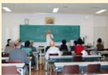
10/21 泉 良平院長

Bさん: 「私のような一般のものは、抗がん剤という副作用が強いイメージを持っている。大腸がんの薬の開発がすすんでいることも聞いて、生きる希望を持てた」