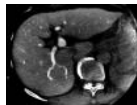
図2. X線アンギオグラフィシステムで撮影した経動脈性門脈造影下CTライクイメージ(肝硬変例)