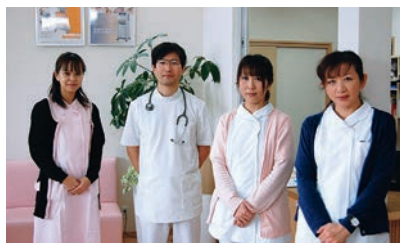
徳舛先生とスタッフの皆さん

新年から雪を降らせた寒気も緩み、道に雪のない日が続いています。1月17日（火）、午前の診療を終えたばかりのくまのクリニックを訪問させていただきました。