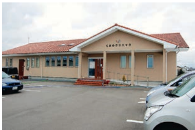
くまのクリニック前景