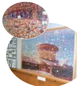
写真で作る「あゆみの郷」

重症心身障害児(者)施設を訪問するのは初めてだったので少し緊張しましたが、施設の方々の献身的なかかわりや熱い想いをお聞きし、これまでのイメージが変わりました。今回の訪問で考えさせられることが多く、大変勉強になりました。地域医療支援病院として、地域の施設の後方病院としての役割を担っていかなければと決意を新たにしながら帰路につきました。