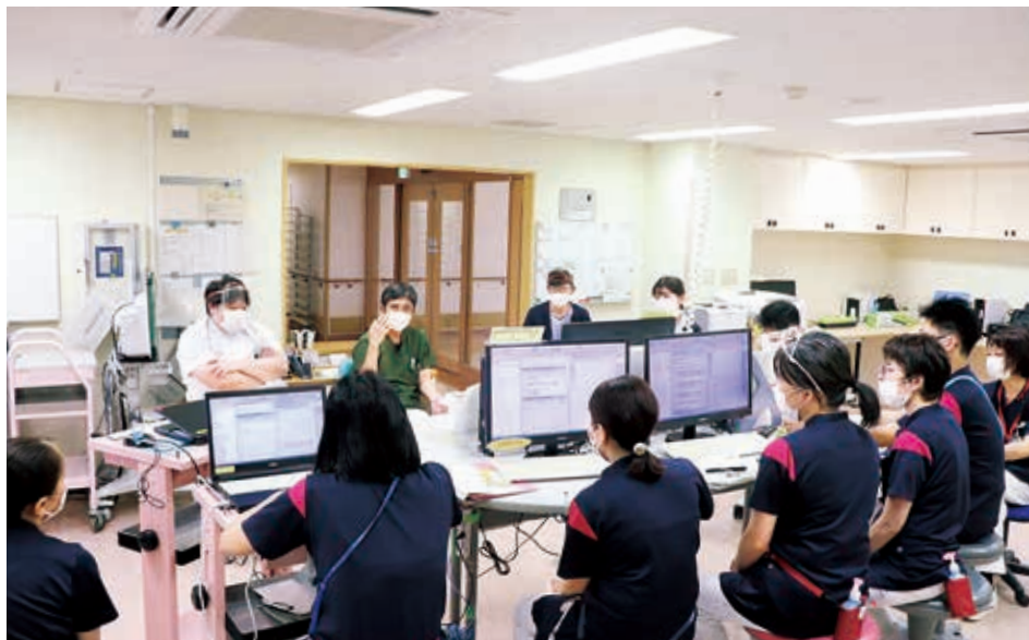
カンファレンスの様子