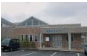
青空クリニック前景